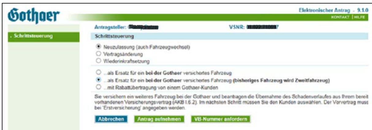
Bild 2: Im Elan wählen Sie den genannten Geschäftsvorfall und klicken anschließend auf „Antrag aufnehmen“.