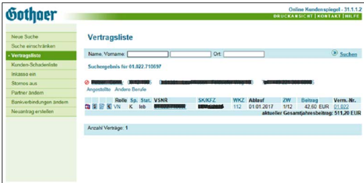
Bild 1: Zunächst erfolgt im Online Kundenpiegel die Suche nach dem Vertrag des Fahrzeugs, das zum Zweitwagen werden soll. Mit Klick auf das Elan-Icon vor dem Vertrag wird dieser selektiert und in den Elan gesprungen.